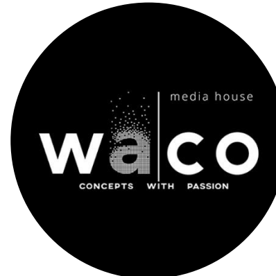
waco media house GmbH Display-Vermarktung ads@waco-media.de